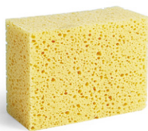
Spugna rettangolare fine

Spugne pratiche e convenienti, ideali per la rifinitura dei pezzi crudi. Prodotte con uno speciale processo di reticolazione, in poliuretano d'alta qualità. Garanzia di ottime prestazioni e durata nel tempo, soprattutto nel caso di forte usura meccanica come avviene nelle fabbriche di ceramica sanitaria. Testate e messe a punto per garantire rifiniture veloci, di qualità e consistenti.