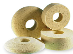
Spugne su disegno