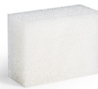
Spugna rettangolare ruvida